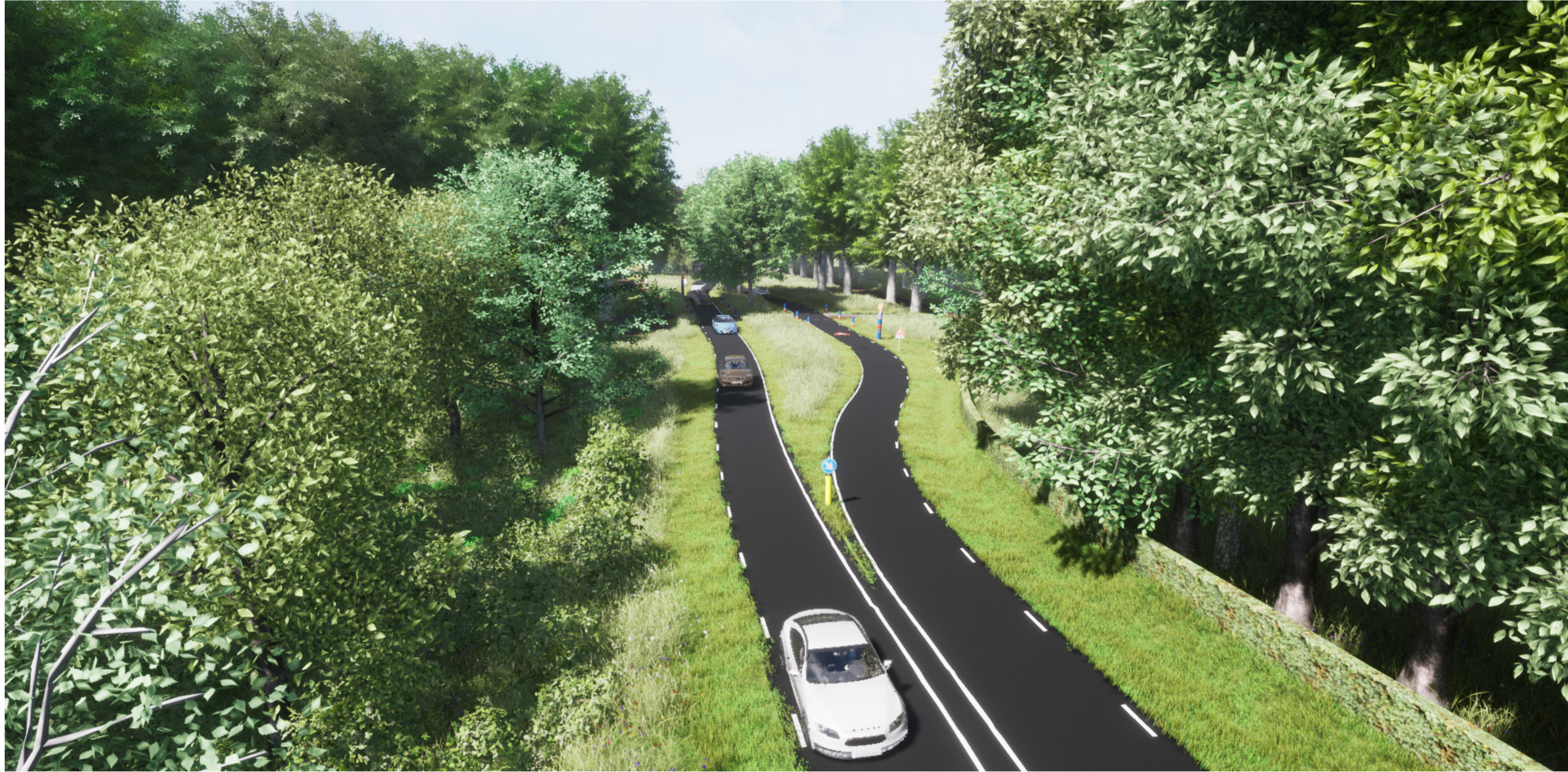
Gescheiden rijbanen ter hoogte van de Sysseletselaan (vanuit oosten)