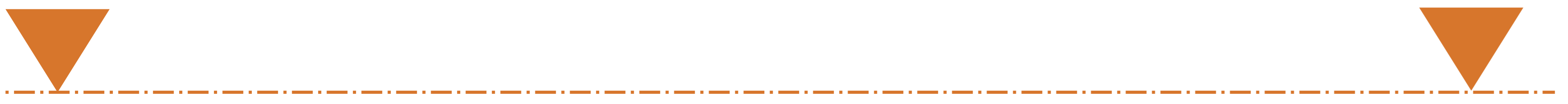
Dwarsprofiel van de Nieuwe Kazernelaan en Parklaan ten oosten van de Langenberglaan