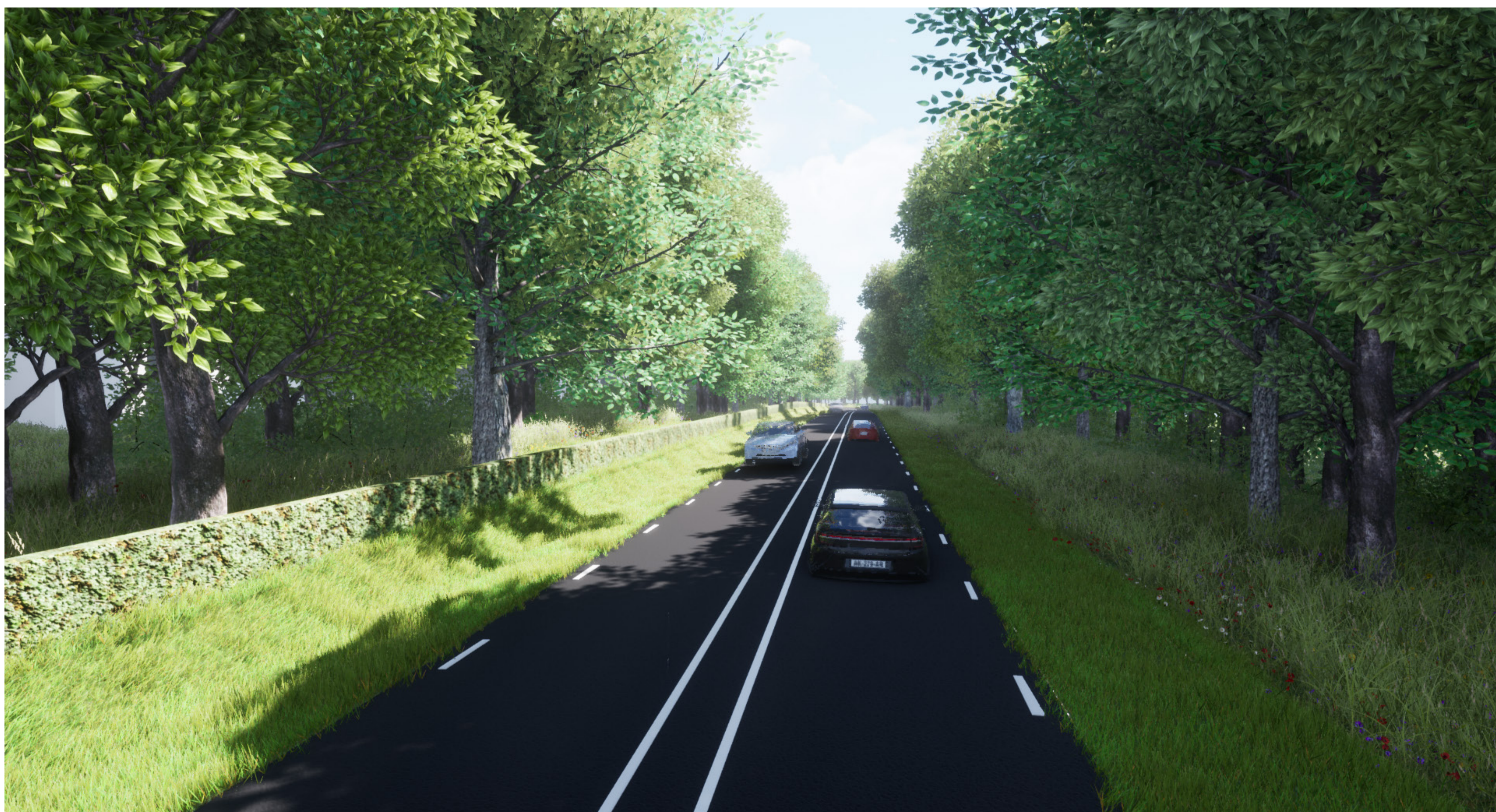
Groen begroeid geluidsscherm tussen de Parklaan en Nieuwe Kazernelaan