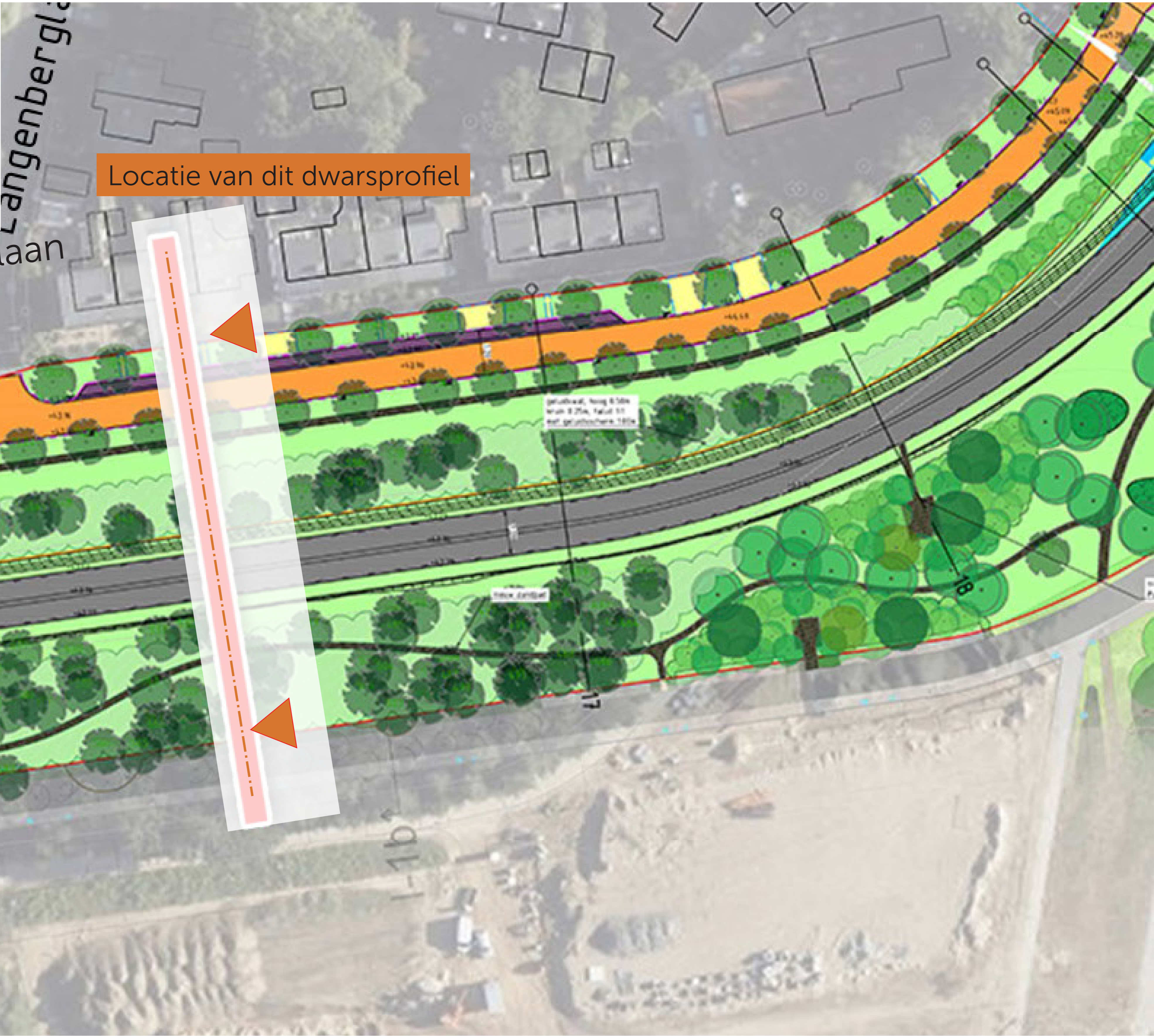
Locatie van dit dwarsprofiel