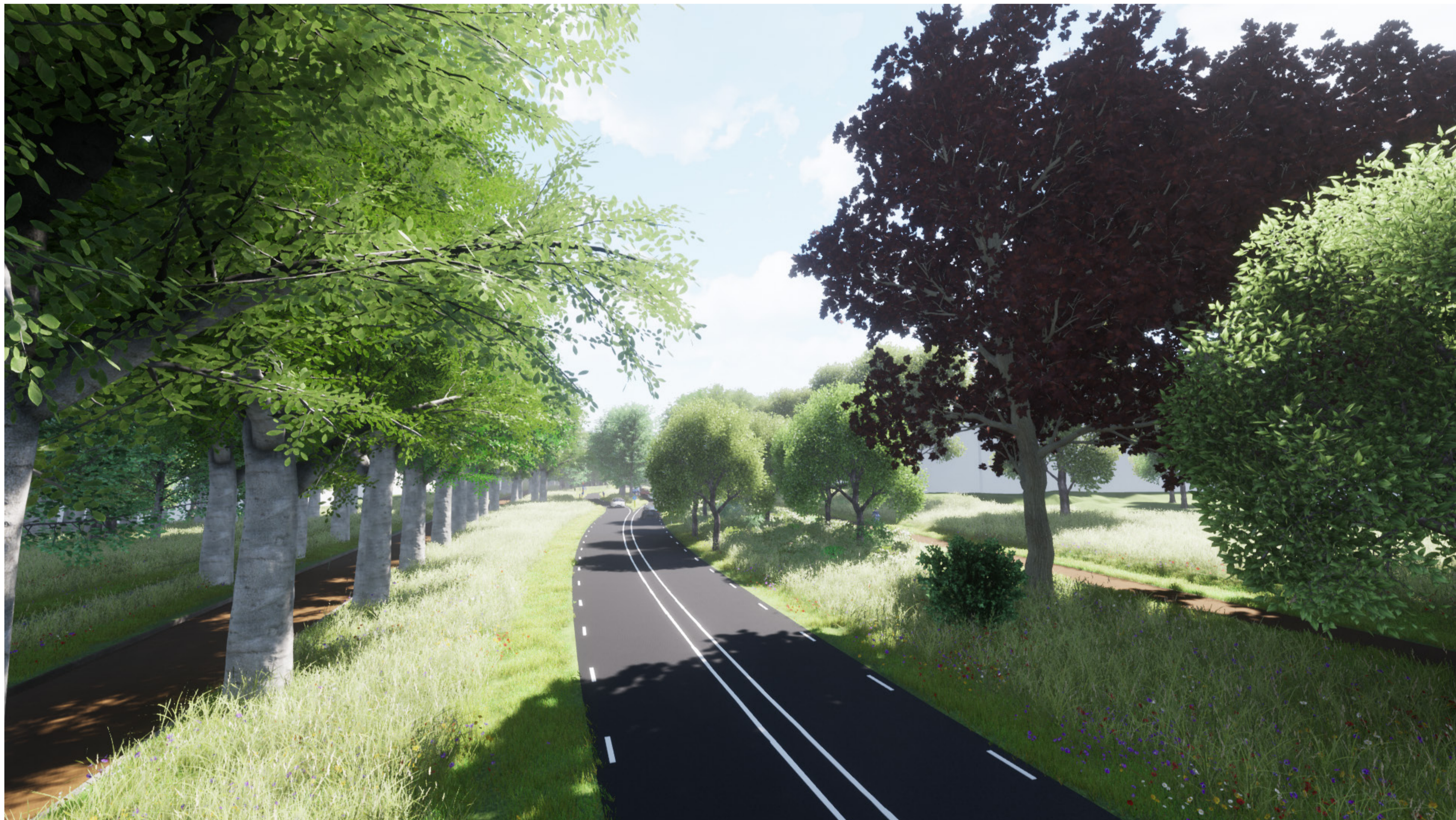
Parklaan parallel aan het fietspad Nieuwe Kazernelaan tussen Sysseletselaan en Ceelman van Ommerenweg