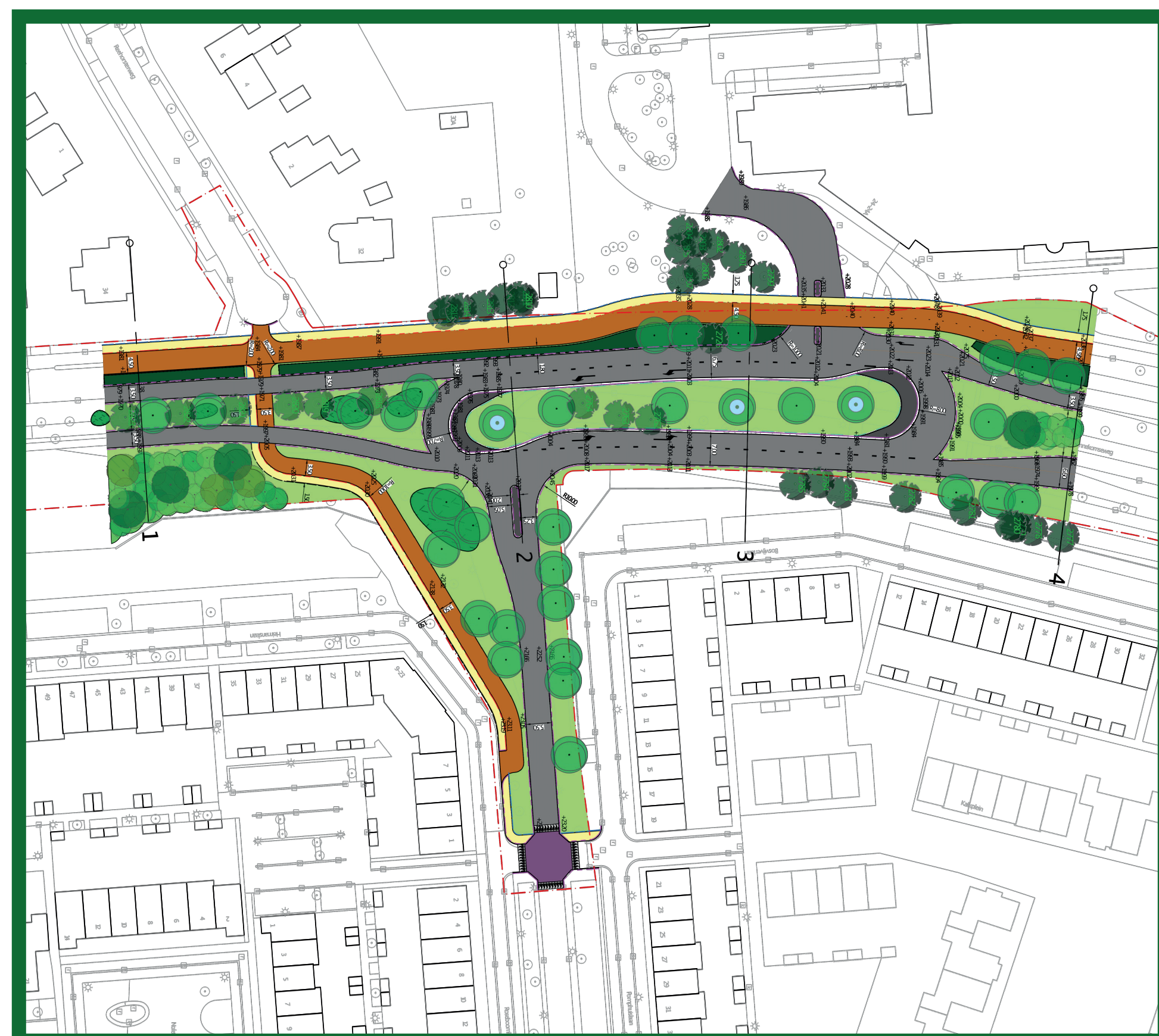
Het ontwerp van december 2020