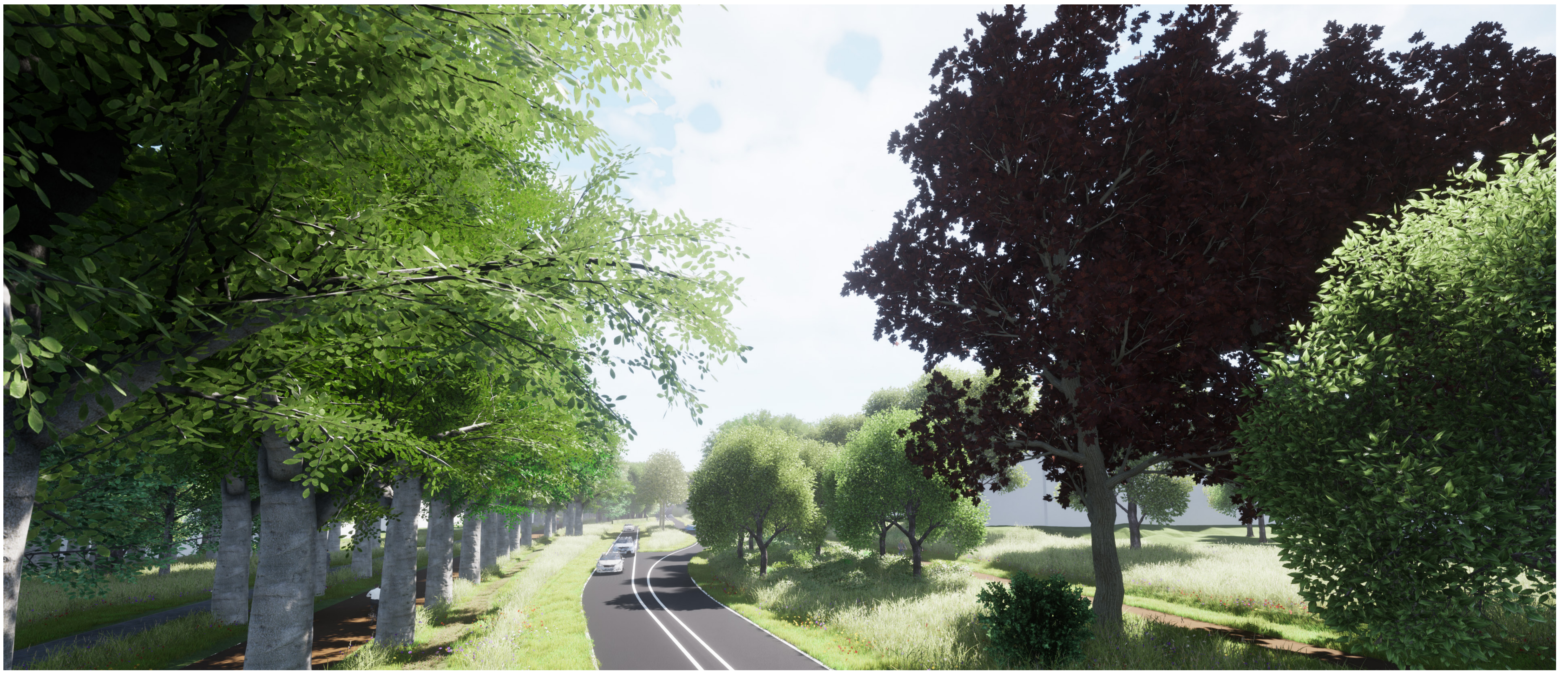
Middenberm tussen de 2 rijbanen (vanuit het westen)