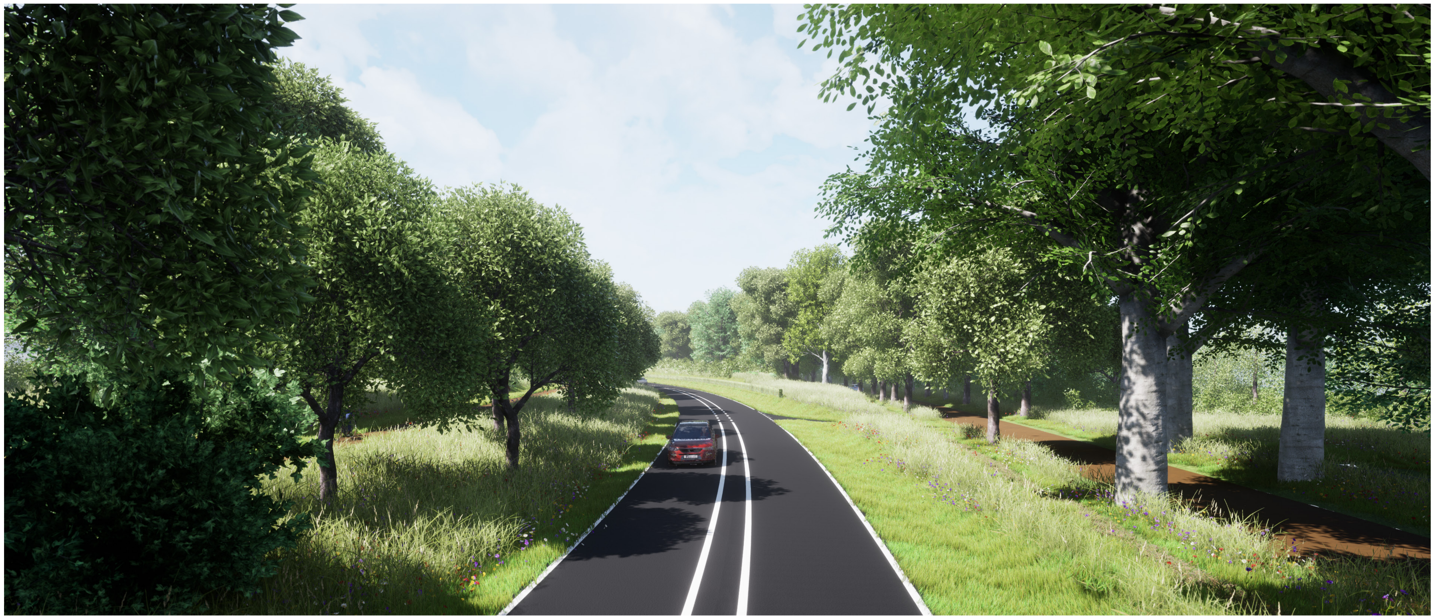
Invoegmogelijkheid Ceelman van Ommerenweg (vanuit het oosten)