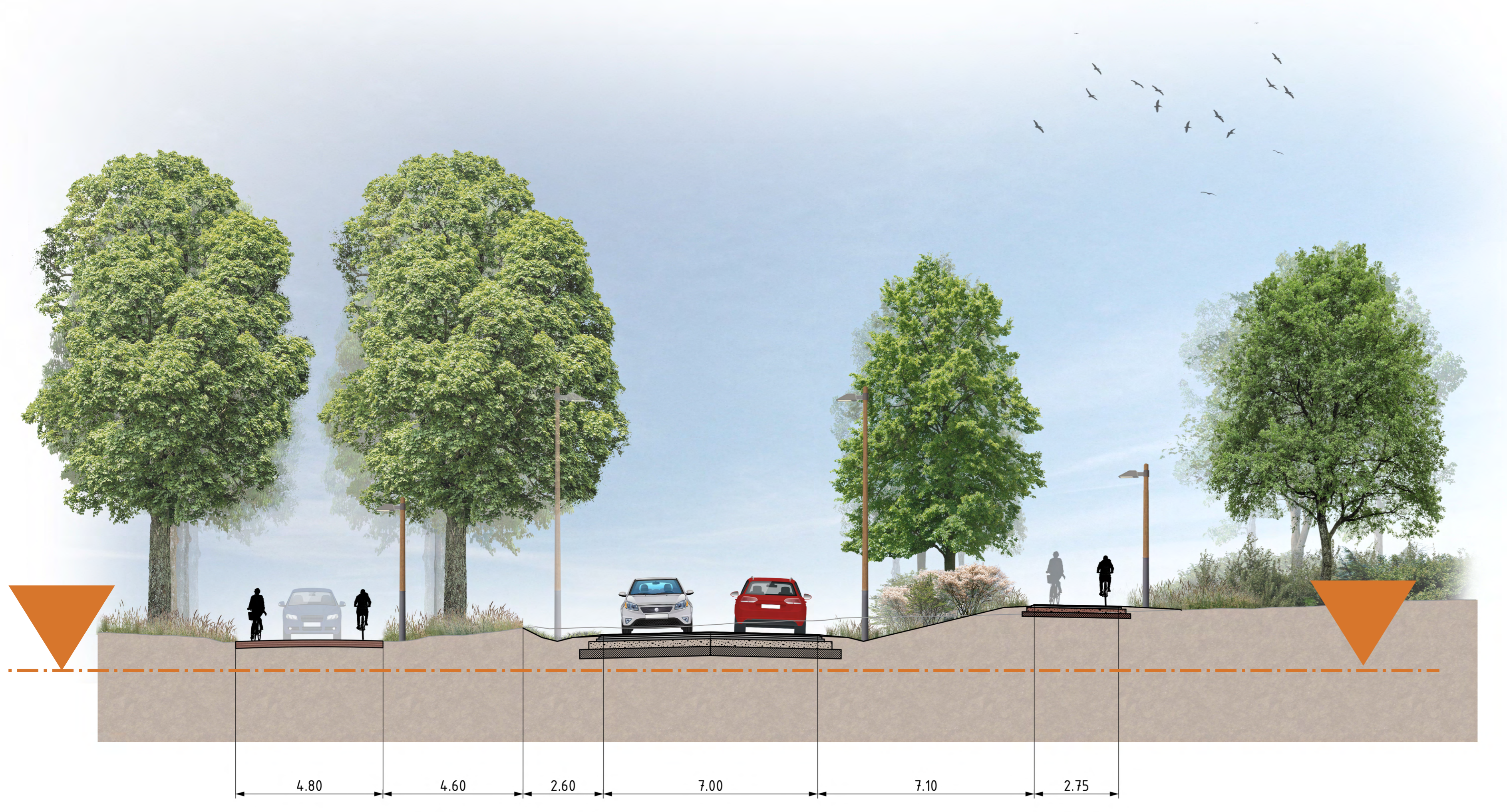
Dwarsprofiel van de Nieuwe Kazernelaan en Parklaan ten oosten van de Ceelman van Ommerenweg